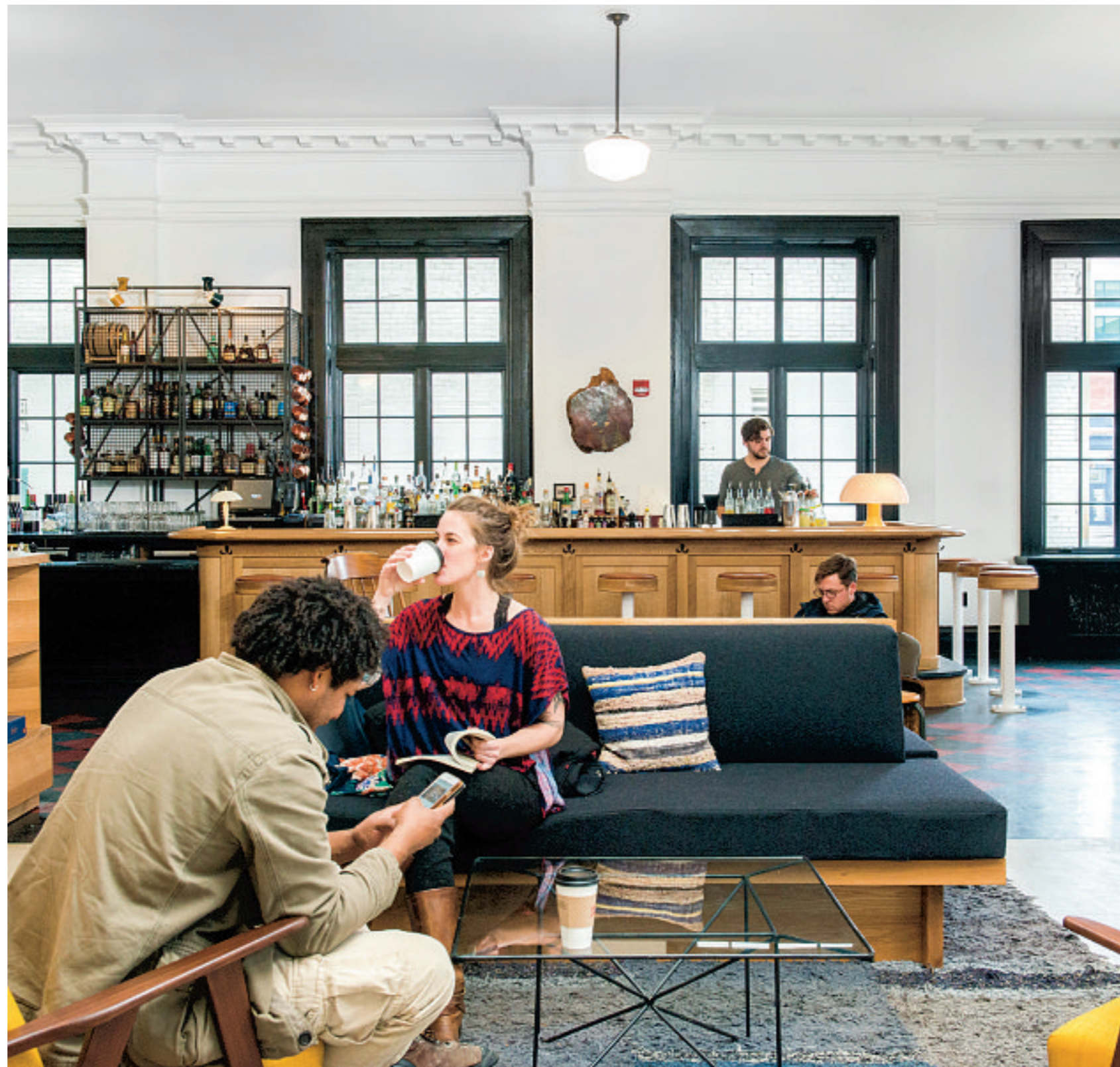
In de Lobby Bar van het Ace Hotel kun je ook terecht voor een kop koffie.

Omdat de staalindustrie niet innoveerde, raakte Pittsburgh in verval. Opmerkelijk genoeg is het