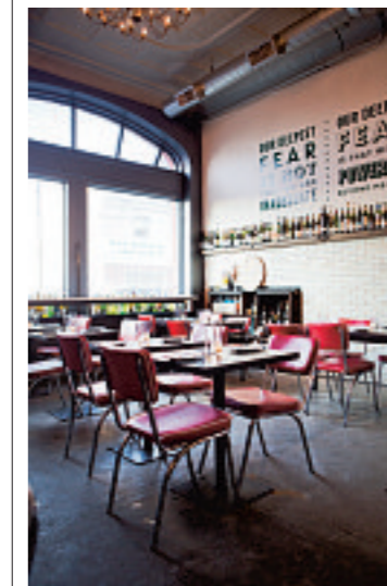
Brunchen bij Bar Marco, dat is gevestigd in een oude brandweerkazerne.

juist innovatie geweest die de stad weer heeft doen swingen.