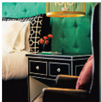
Hotel Monaco is ingericht in art-decostijl. Boven: Butlerstreet in Lawrenceville, het Brooklyn van Pittsburgh.

museum voor moderne kunst in Amerika. En de kunstverzameling van dochter Helen Clay Frick is, samen met de autocollectie van vader Henry, te bezichtigen op het voormalig landgoed van de familie.